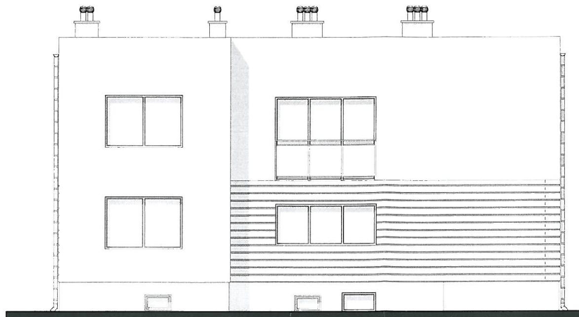
Elewacja południowo - zachodnia